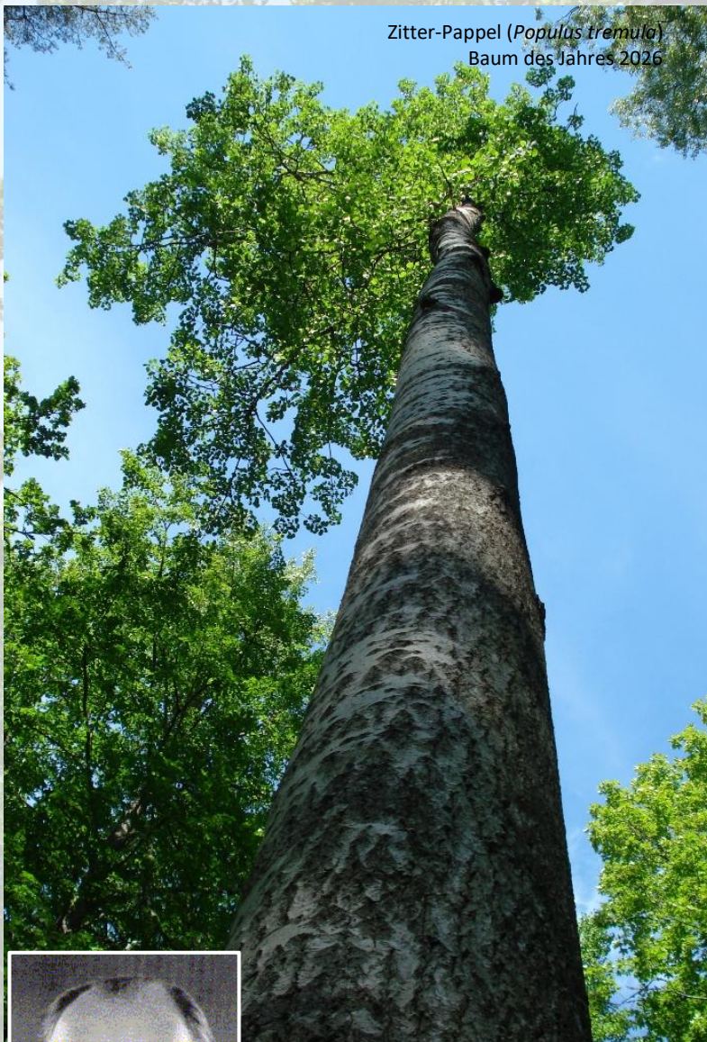
Zitter-Pappel ( Populus tremula ) Baum des Jahres 2026