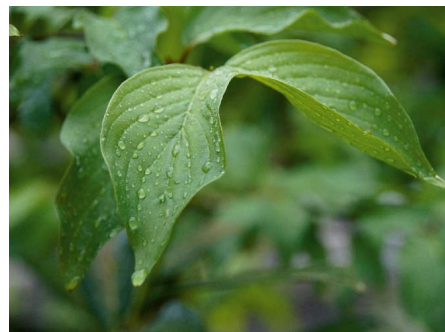
// Zur Blattspitze gerichtete Blattadern kennzeichnen Cornus mas als Hartriegelgewächs. //