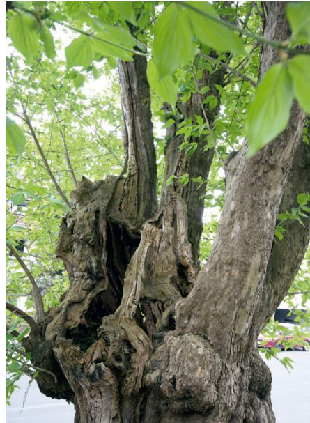
// Beulige Verwachsungen und ein hohler Stamm erschweren die Altersbestimmung. //