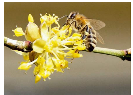
// Wegen ihrer zeitigen Blüte ist die Kornelkirsche ein wichtiges Bienengehölz. //