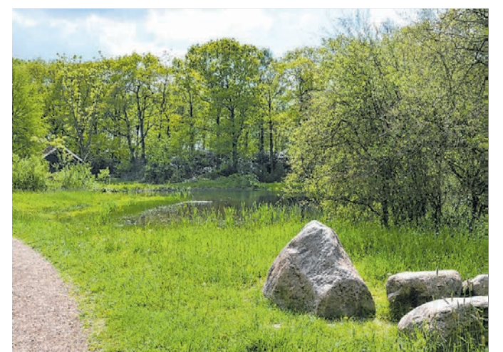
Seit 1972 ergänzt ein angelegter Teich die Parklandschaft.