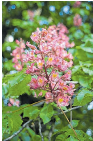
Die Rote Roskastanie blüht.