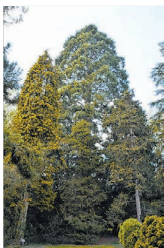
Mächtig: der Mammutbaum.