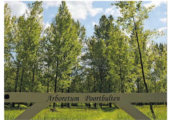
„ Poort Bulten “ ist mehr als 100 Jahre alt.