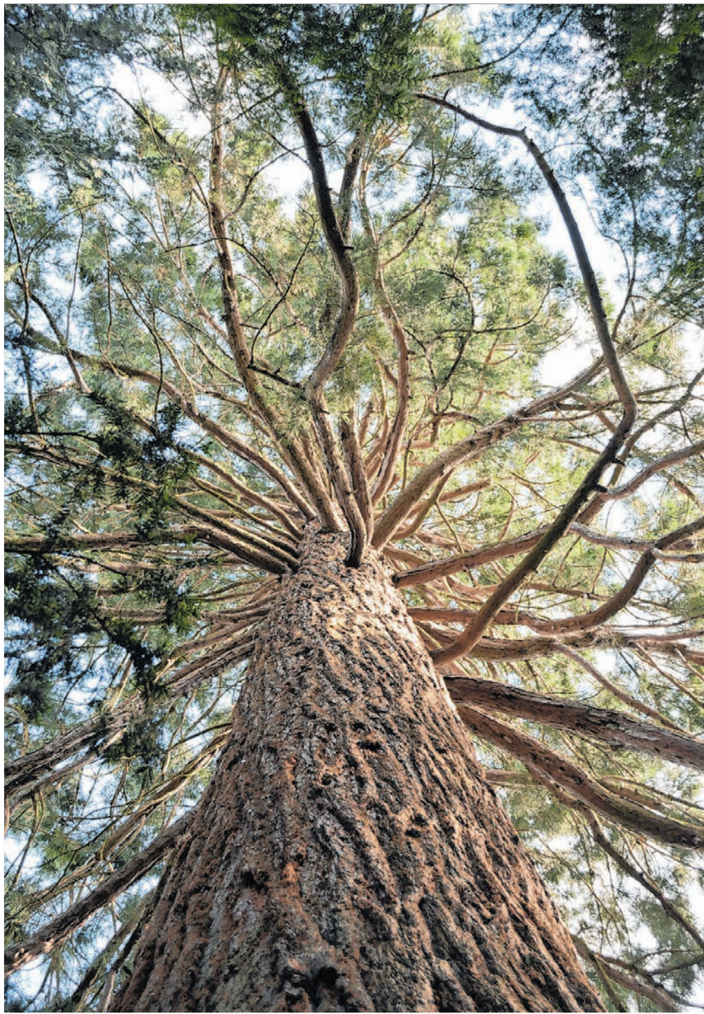
Der Mammutbaum mit seinem dicken Stamm ist ein beliebtes Motiv des Arboreums.