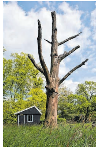
Totholz als Lebensraum.