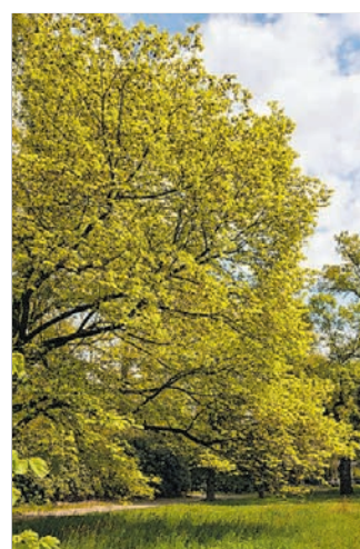
Weit verbreitet ist die Ulme.