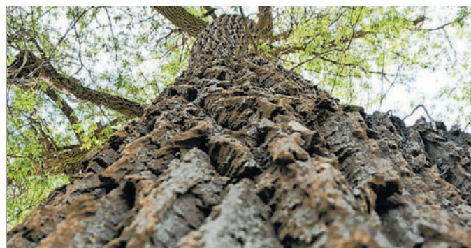
Über eine knorrige Rinde geht der Blick in die Pappelkrone.