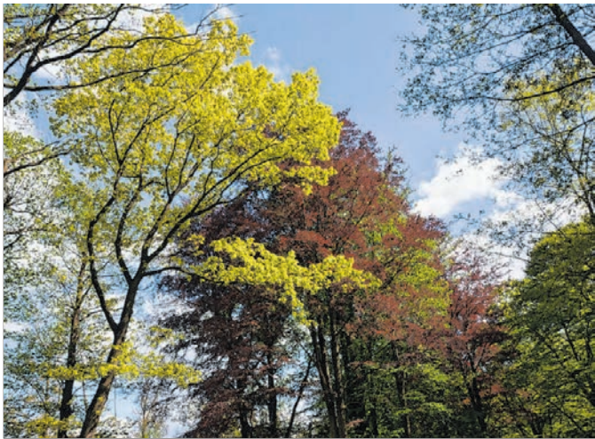
Farbspiel in den Kronen dank verschiedener Zuchtformen.