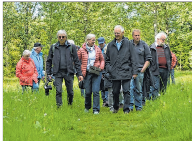
Auch auf Wiesenpfaden lässt sich das Gelände erkunden.

Das Gelände von „Poort Bulten“ kann über feste We-