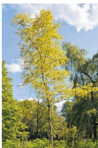
Die Goldbirke in sattem Grün.