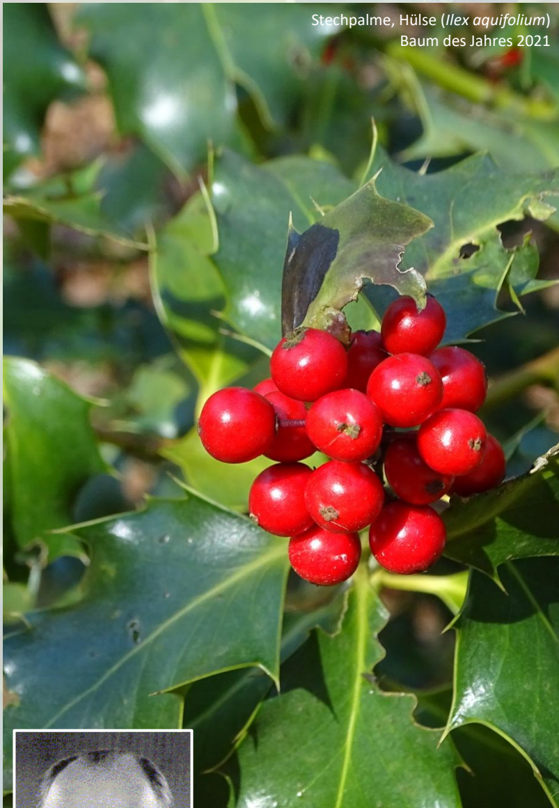
Stechpalme, Hölse ( Ilex aquifolium ) Baum des Jahres 2021