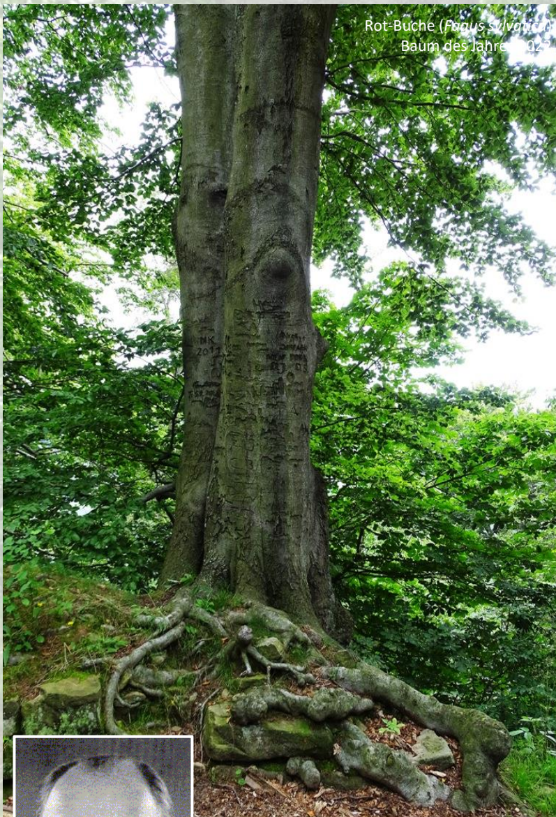
Rot-Buche ( Fagus sylvatica ) Baum des Jahres 2022