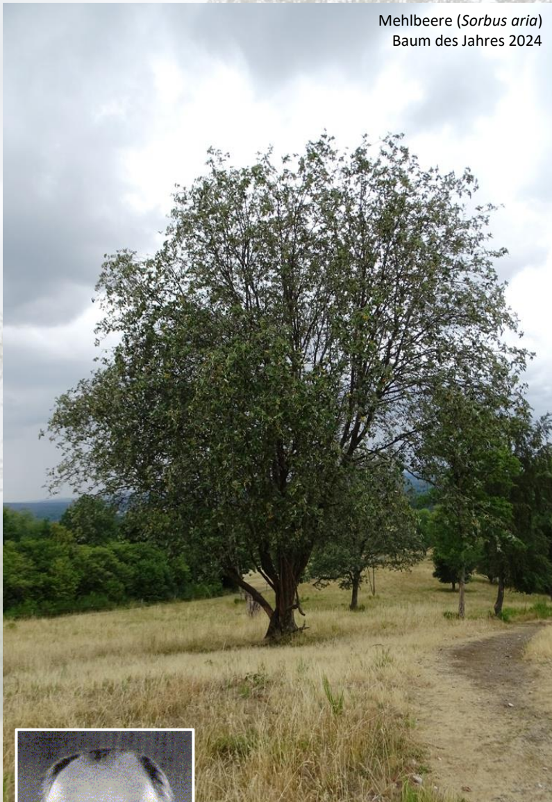
Mehlbeere ( Sorbus aria ) Baum des Jahres 2024